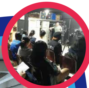
圖下. 校園彩繪作品評圖現場