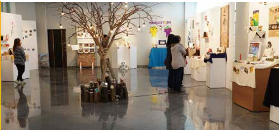
A B 圖A. 透視課之建築物繪製 C 圖B. 趙家窯參訪 圖C. 第五屆畢業展覽【拾荒·拾光】