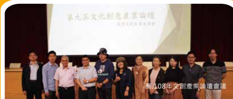
圖.108年文創產業論壇會議

本所成立的目的是在於培育既具備文化美學涵養又能企畫執行的跨領域人才，此特色將能為為數眾多的文創產業單位提供能夠在第一時間點上線作業的人才，又能以其深厚的學術涵養，帶動產業發展之遠景。