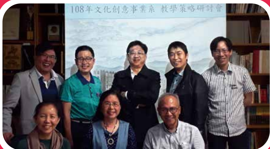
圖.107學年度108/4/2教學策略研討會全體合照

本系/所的解決之道是：除了良好的課程設計之外，又與全台30個文化事單位訂有策略聯盟關係，這些經營十年以上、具有厚實經營實力的美術館、科博館、出版業、影視業、流行音樂產業、跨領域整合行銷公司、文化創意產業公司等等，均能提供學生除了課業之外的產業觀察，透過密切的產官學合作模式，當能達到文化、創意與產業三者相加相乘的效果。