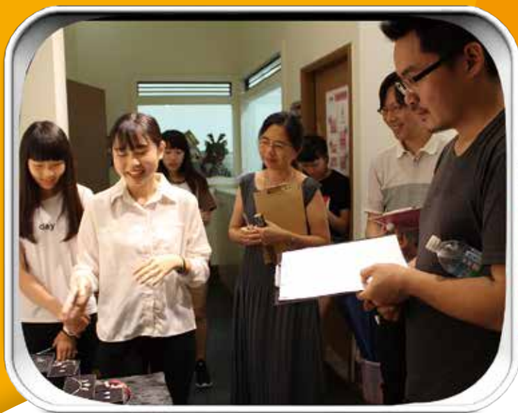
圖. 文創經典設計評圖現場

本系師資健全，以文創產業最需要的「跨領域整合」為主要特色， 全台灣唯一能進行影音結合的系所， 能让你成為職場最夯的乘法人！