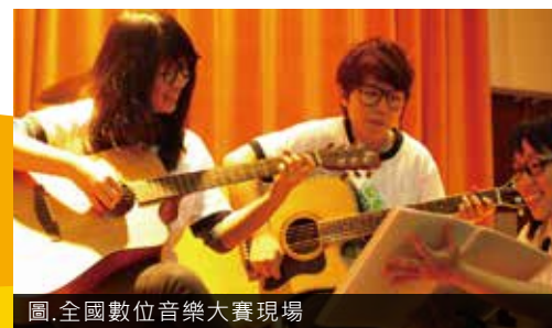
圖.全國數位音樂大賽現場