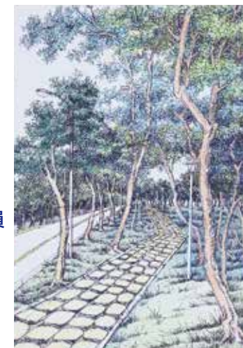
圖.施世昱繪新校區一景