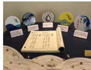
A B 圖A. 文創經典設計評圖現場 C 圖B. 白蛇傳之經典文創商品設計 圖C. 經典文創商品設計—上若若水